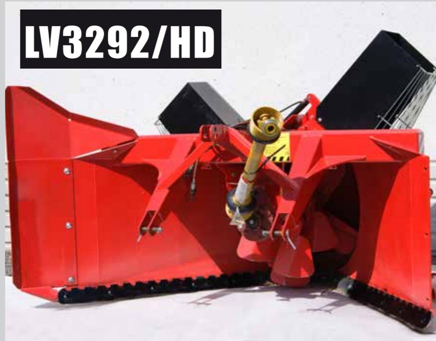
HD -mallissa syöttökoneisto on rakennettu vapaasti heiluvilla lavoilla. Alennusvaihteen välitys 1,87. Linko toimitetaan ilman nivelakselia.

Pää-, sivu- ja metsäautoteiden tehokkaaseen lumenaurausurakointiin. Lapasyöttöisissä LV3292 -lumilingoissa on alennusvaihe, hydraulisesti ohjattu luukunohjaus, portaattomasti säädettävät kannatinjalakset sivuilla ja takana, oikeanpuoleinen vallileikkuri ja kaksipuoleinen jääterä vakiovarusteina.