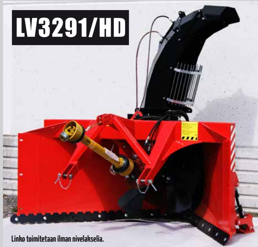
Linko toimitetaan ilman nivelakselia.

Taajama-alueiden ja kiinteistöpihojen tarkkuutta vaativaan lumenaurausurakointiin. Lapasyöttöisissä, 1-torvisissa LV3291 -lumilingossa on alennusvaihe, hydraulisesti ohjattu torvenohjaus, portaattomasti säädettävät kannatinjalakset sivuilla ja takana, oikean-puoleinen vallileikkuri ja kaksipuoleinen jääterä vakiovarusteina. HD -mallissa syöttökoneisto on rakennettu vapaasti heiluvilla lavoilla. Alennusvaihteen välitys 1,47.